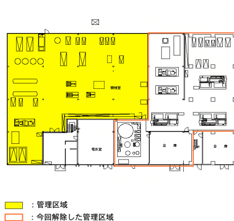
図2 P S エネルギーセンター1階平面図 S=1/200

配布先：機構長、素核研所長、物構研所長、加速器施設長、共通施設長、素核研副所長、 物構研副所長、各研究所主幹等 各区域放射線担当者、放射線管理室員、安全衛生推進室、各事務室