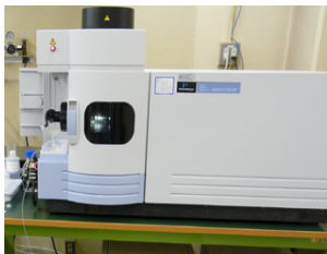
ICP発光分光分析装置

また、素粒子・原子核コースの実習では、めっき作業のために化学実験棟の実験室を提供しました。